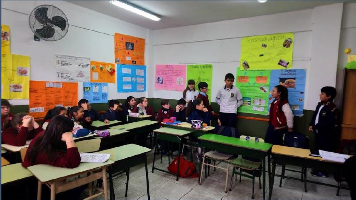
Proyecto de Alimentación Saludable