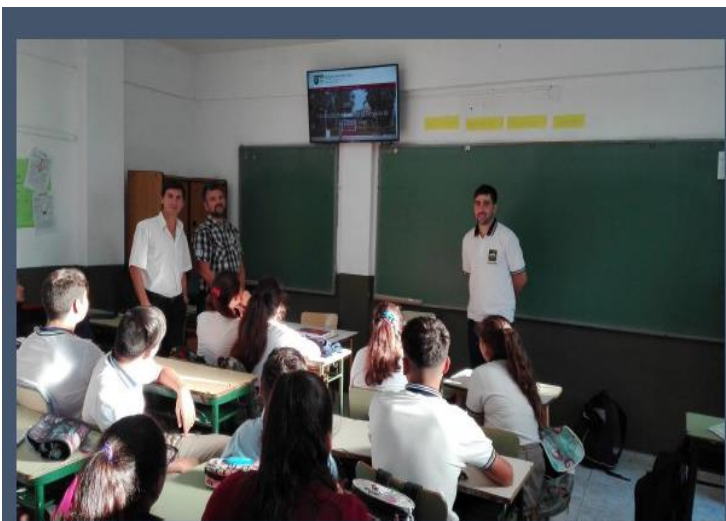
Nuevas tecnologías en el aula.